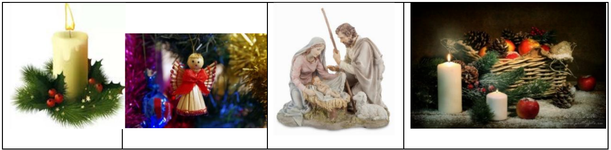
А) Новый год Б) Рождество Христово В) Благовещение